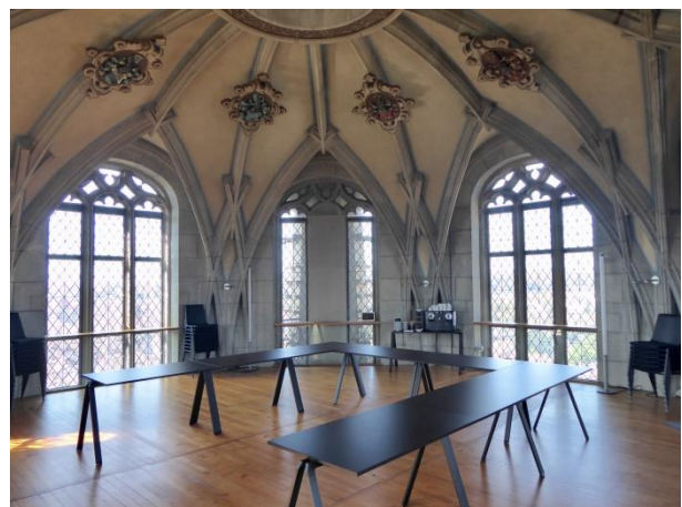
Der Gewölbesaal – 50m über Boden